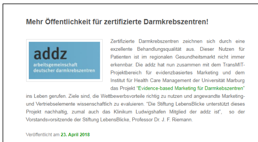
Abb. 7: Eintrag auf der Startseite der Seite www.lebensblicke.de (Stand: 02.05.2018)