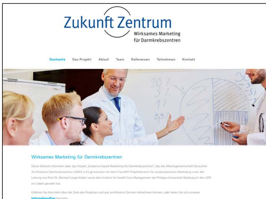
Abb. 1: Startseite der Internetpräsenz www.marketing-fuer-zentren.de

Zur umfangreichen Information über das Projekt wurde in Zusammenarbeit mit dem Kooperationspartner impressum eine dedizierte Projektwebsite ( www.marketing-fuer-zentren.de ) erstellt, auf welcher in umfassender Art und Weise über das Gesamtprojekt informiert wird. Dabei wird auf der Startseite zunächst über die wesentlichen Zielsetzungen des Gesamtprojekts berichtet. Von dieser Seite sind die übrigen Unterseiten der Website erreichbar (Das Projekt, Ablauf, Team, Referenzen, Teilnehmen, Kontakt). Abb. 1 zeigt den oberen Bereich der Startseite des Internetauftritts.