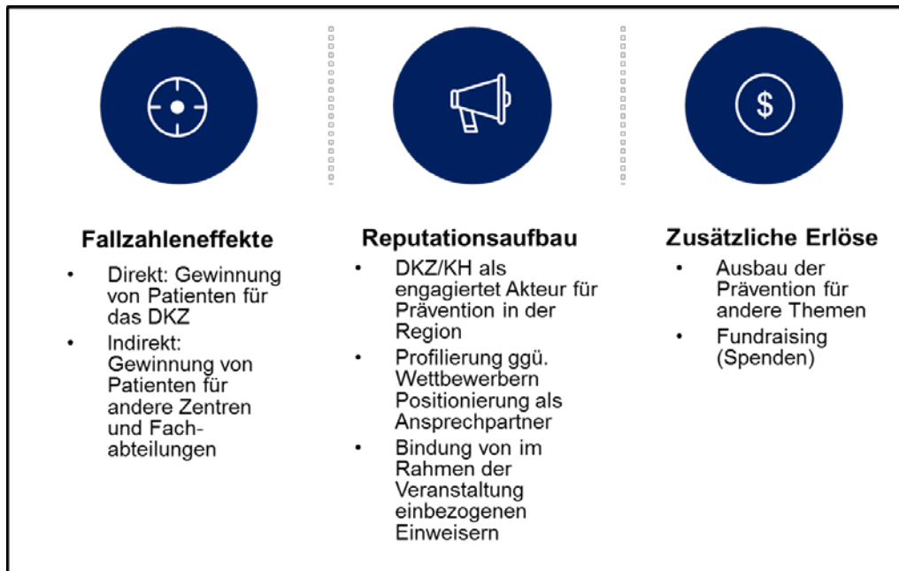
Abb. 8: Im Rahmen der Effektmessung identifizierte Effekte von Firmenveranstaltungen